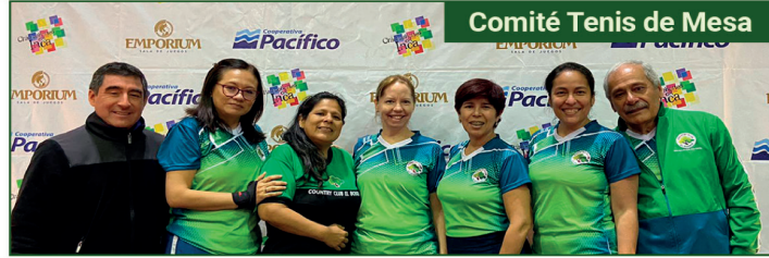
Comité Tenis de Mesa

Medalla de oro categoría 40 años individual damas